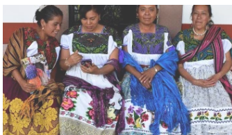
Conacyt cumple programa de becas a mujeres indígenas En "Nacional"