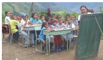
Desigualdades en sistema educativo, persisten En "Destacado"