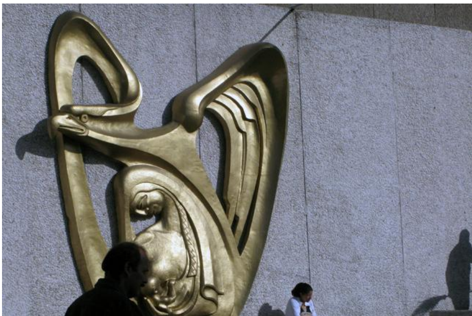
De aprobarse, los afiliados recibirían 600 pesos mensuales más.