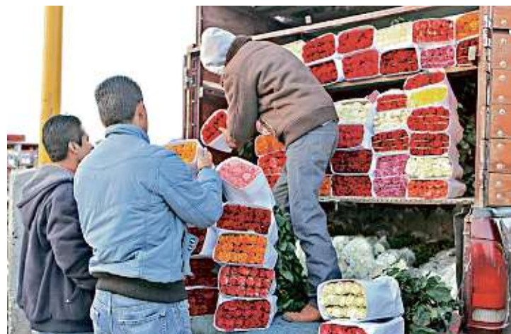
Los comerciantes pueden vender las flores hasta 30 por ciento más caras en fechas como San Valentín.

Para prepararlas, mantenerlas frescas y venderlas el 14 de febrero, los productores hasta las congelan