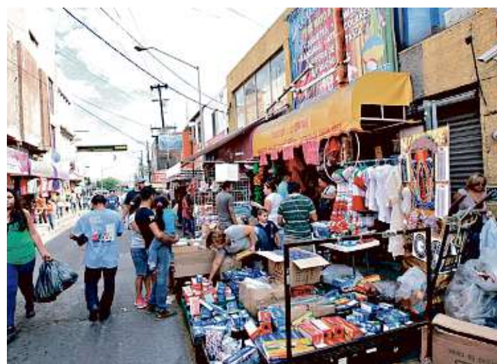
El total de mujeres en el sector informal repuntó el cuarto trimestre de 2013 en 120 mil personas.