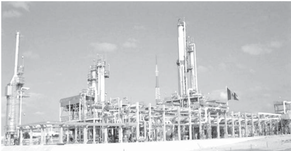
Aniversario 75 de la expropiación.

Insostenible, el esquema con el que 80% de sus ingresos son destinados al Estado: investigadora del IIEc