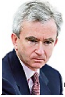
► Bernard Arnault, el hombre más rico de Francia