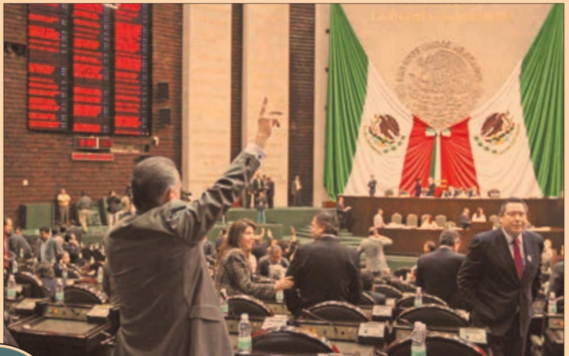
Analistas afirman que el Congreso subestimó el alcance de la crisis internacional.

Lo anterior, según la investigadora, representa la peor salida des-