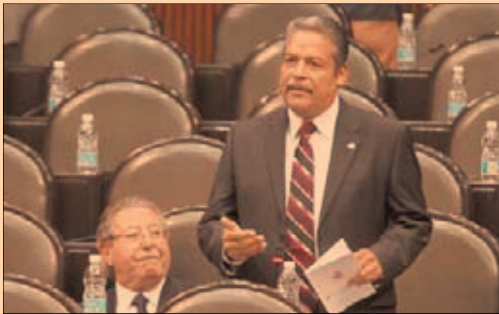
Tereso Medina , presidente de la Comisión del Trabajo y Previsión Social en la Cámara de Diputados.