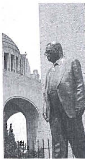
Fidel Velázquez.

"La CTM carece de bases porque los trabajadores no ven en ella una opción real para la defensa de sus derechos... militancia real no hay."