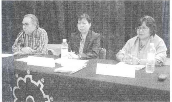
Los ponentes coincidieron en que el medio rural tendrá una mejora económica, cultural, política y social con ayuda de los profesionales de Planificación para el Desarrollo Agropecuario.