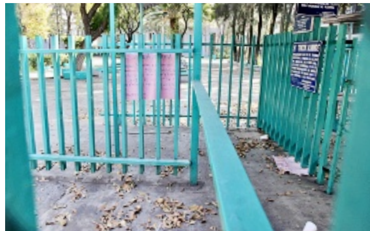
> Las guardias de los huelguistas no se preocupan por las condiciones en que se encuentran los accesos de las escuelas.