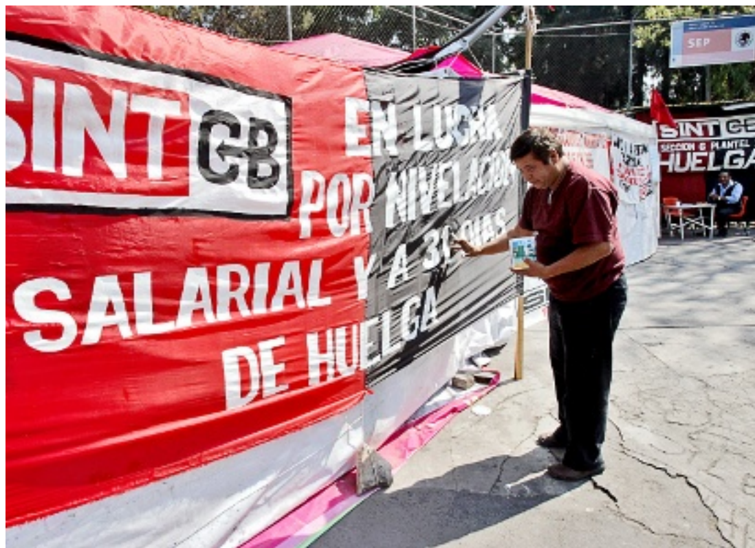
EN VEREMOS. Mientras las banderas siguen colocadas en los planteles, la audiencia en la Junta Federal de Conciliación y Arbitraje para determinar si la huelga es legal o no, se aplazó.