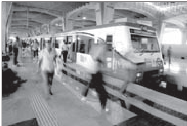
Alcances. El sistema transportará a 100 millones de usuarios por año.

Lea más en: eleconomista.com.mx/empresas