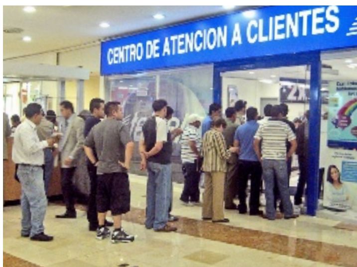
Los clientes de Telcel no les importó hacer largas colas, con tal de impedir que les cancelen su línea celular a partir del domingo.