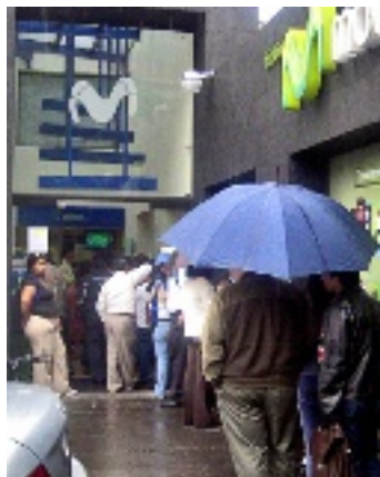
También hicieron filas clientes de Movistar.