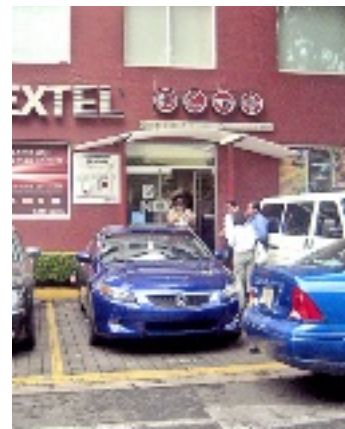
Aunque pocos, usuarios de Nextel buscaron registrarse.